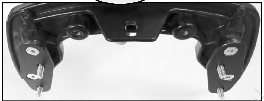
Montage bei Verlegung nach oben Mounting when installed upwards

Nun die vormontierten C-Bows samt Sechskantschrauben M6x18 mit den selbstsichernden Muttern M6 sowie U-Scheiben Ø6,4 an den C-Bow Haltern verschrauben.